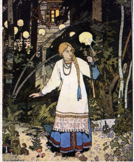
Illustration du conte Vassilissa la Belle , Ivan Bilibine, 1900

Vassilissa et Baba Yaga raconte la quête initiatique d'une petite fille qui surmonte les épreuves que lui impose la vie. Le conte, comme repère d'un imaginaire collectif, retrace les événements fondateurs qui nous construisent, livrant une vision du monde non manichéenne.