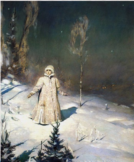
Snégourotchka , Viktor Vasnetsov, 1899

Le texte à partir duquel nous travaillons est une synthèse entre les versions d'Afanassiev et de P.Estés. La première se conclut sur le mariage de Vassilissa avec le tsar tandis que la deuxième se clôt sur la fin des épreuves de la jeune fille. Souhaitant mettre l'accent sur la construction symbolique de Vassilissa, nous avons privilégié le final de la deuxième version.