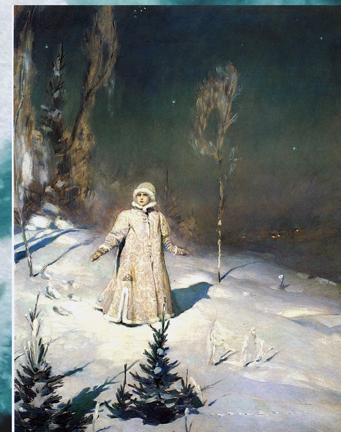
Snégouroitchka , Viktor Vasnetsov, 1899