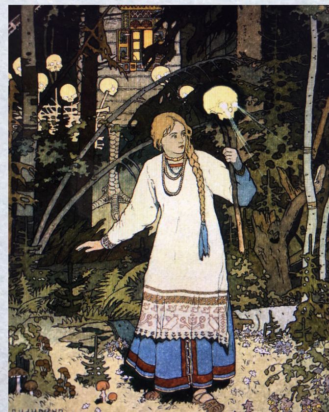
Illustration du conte Vassilissa la Belle , Ivan Bilibine, 1900

Le texte à partir duquel nous travaillons est une synthèse entre les versions d'Afanassiev et de P.Estés. La première se conclut sur le mariage de Vassilissa avec le tsar tandis que la deuxième se clôt sur la fin des épreuves de la jeune fille. Souhaitant mettre l'accent sur la construction symbolique de Vassilissa, nous avons privilégié le final de la deuxième version.